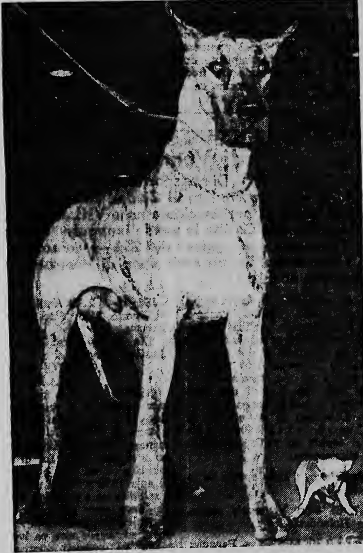
„Count Down”, un cacho grandi di raza ta haci su mes digno di por forma amistad cu un cos di nada manera „Li l Abner”, un Chihuahua, durante un show di cachonan na Philadelphia.

Esey tabata un dia tristu pa e pober mama.